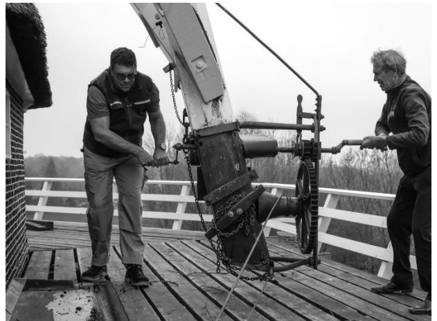
Kruien op de echte manier, oftewel op handkracht.

Hemsen) blijkt een prima fotograaf. Zie hier twee van zijn foto's.