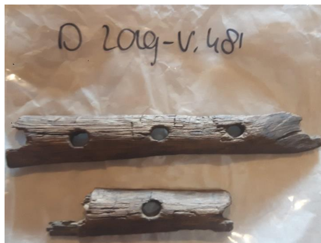
D 2019-V.481 ; “2 fr. van houten plankje met 7 gaten, mogelijk van een hark”